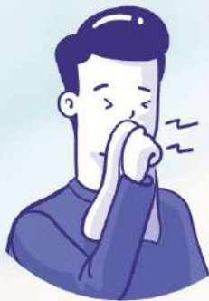
Cover coughs and sneezes