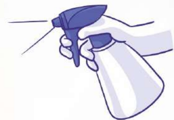
Clean and disinfect

Emergency Help Line : 079 232 00 108/109, 95 37 47 44 44