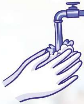
Clean your hands often