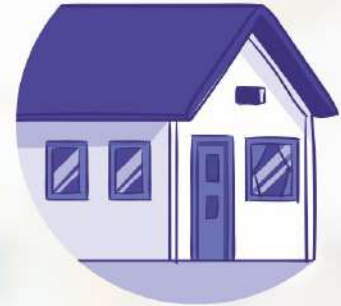
Stay at home