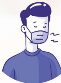
Wear a facemask if you are sick